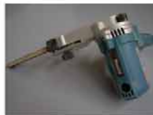
Mini sega circolare