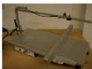
Trafo con filo a caldo